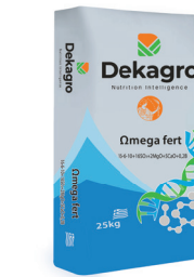
Omega fert 16-6-10-16S03+2MgO+5CaO+0,2B