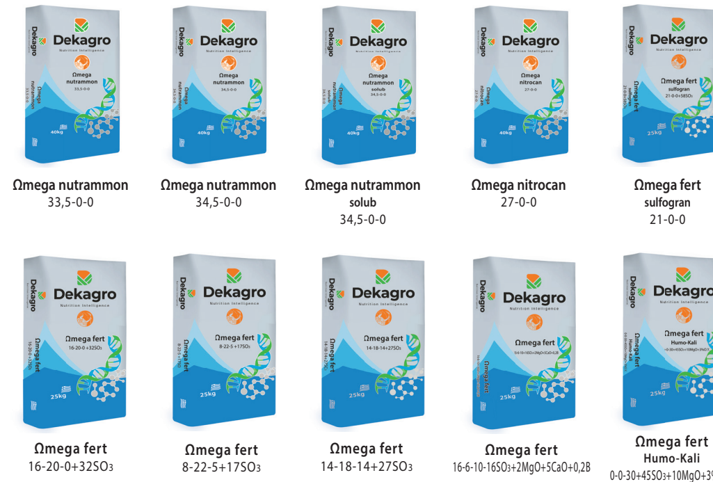
Omega nutrammon 33,5-0-0