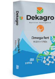
Omega fert 8-22-5+17S03