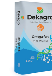
Omega fert 14-18-14+27S03