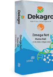
Omega fert Humo-Kali 0-0-30+45S03+10MgO+3%O.Y.