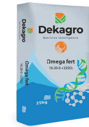
Omega fert 16-20-0+32S03